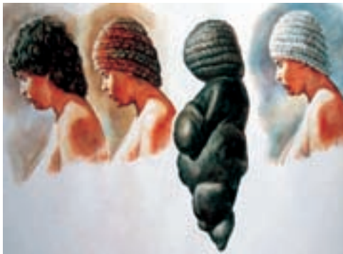
Venuše z Willendorfu (rekonstrukční transformace), autor Libor Balák.

V mladém paleolitu vzrůstá počet nálezů uměleckého charakteru - malby v jeskyních, rytiny na skalách, rytiny na kostech zvířat. Obrazy věrně ztvárňují lovenou zvěř, často s naznačenými smrtelnými zásahy. Tyto výjevy zřejmě souvisejí s magickými obřady, které měly zajistit úspěšný lov a ochránit lovce. Podobný účel přisuzujeme také drobným soškám zvěře vyrobeným z kamene, kostí, mamutích klů a dřeva. Nalezené sošky žen spojujeme s kultem plodnosti (zdržněna hrud a boky). Z Dolních Věstonic pochází světoznámá „věstonická Venuše“, z rakouského Willendorfu soška ženy s naznačeným účesem. Další typy sošek známe např. z Kostěnků, Ukrajina; Savignano, Itálie; Brassempouy, Francie; Gönnersdorf a Nebra, SRN; Malta; Sibir; Rusko atd... Starší paleolit (3/2,5 mil. – 300.000 přnl.), jehož nositelem byl v podstatě ještě předchůdce člověka, je charakteristický především hrubými nástroji pěstních klínů (abbevillien, acheuleen) a masivních úštěpů (clactonien, levaloisien).