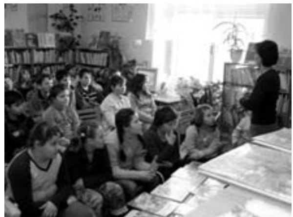
Knihovnu navštívili i žáci ze ZŠ Skalice. Z jejich reakcí soudíme, že se jim to velmi líbilo.