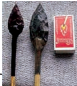
Konstrukce zbraní - stěly pro luk, autor Libor Balák

Krumlovského lesa byly v pozdních fázích starého a ve středním paleolitu docela hustě osídleny. Z mladého paleolitu můžeme jmenovat nálezy např. z Vedrovic, Jezeřan-Maršo-vice, Kubčic a Šumic. Jedná se o listovité hroty, škrabadla, retušované čepele a rydla. Nejbohatší památky po mladopaleolitickému člověku vydala světoznámá naleziště pod Pavlovskými kopci (Dolní Věstonice, Pavlov), jeskyně Moravského krasu, stanice ve středním Pomoraví (Předmostí u Přerova) a v oblasti Moravské Brány (Petřkovice).