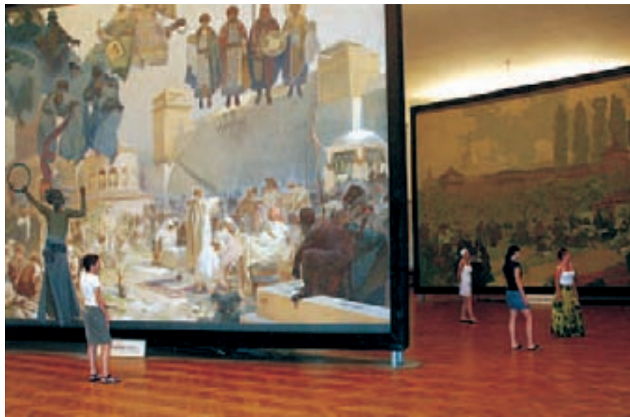
Plátna Muchovy Slovanské epeje.